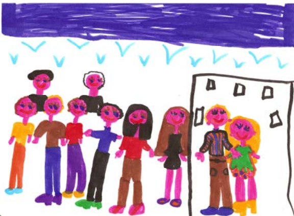
Marie L.: Les enfants et les maîtres devant l'école

Le lundi 1 er septembre : rentrée des classes, ouverture de l'école française de Taishan.